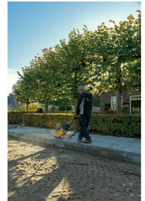
Emissievrij werken met de elektrische trilplaat