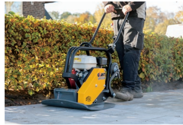
De GP2155G aan het werk op de bouw

De ontwikkeling en productie van trilstampers en trilplaten vindt reeds sinds 1976 plaats in Nederland. Vanuit een moderne fabriek in Zwolle worden machines en onderdelen in eigen beheer ontwikkeld en geproduceerd. Door gebruik te maken van de modernste technologie, continue innovatie en gebruik van de beste componenten worden GIANT machines met de grootste zorgvuldigheid en kwaliteit geproduceerd.