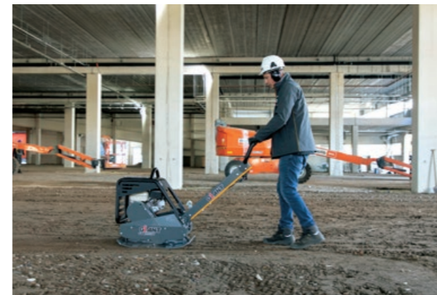
Met de beugel is de richting eenvoudig aan te passen