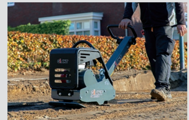
Krachtige prestaties voor een goede verdichting