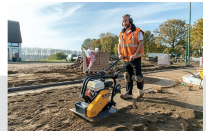
Nauwkeurig werken door de gevormde grondplaat